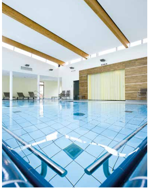
Ansicht Zentrum für Prävention, Therapie, Rehabilitation und sportmedizinische Diagnostik, Standort St. Anna Hospital

Das Zentrum für Prävention, Therapie, Rehabilitation und sportmedizinische Diagnostik der St. Elisabeth Gruppe, Katholische Kliniken Rhein-Ruhr, ist an fünf Standorten in Herne und Witten aktiv. Dazu gehören das St. Anna Hospital, das Rheumazentrum Ruhrgebiet, das St. Marien Hospital Eickel, das Marien Hospital Herne Mitte – Universitätsklinikum der Ruhr-Universität Bochum sowie das Marien Hospital Witten. Das therapeutische Spektrum umfasst diagnosebezogene Einzel- und Gruppenbehandlungen der stationären und ambulanten Gesundheitsversorgung. Dazu zählen sämtliche physiotherapeutischen und physikalischen Maßnahmen ebenso wie Präventionsangebote, auch im Rahmen der Erweiterten Ambulanten Physiotherapie (EAP). Zudem bietet das Zentrum eine moderne, medizinisch fundierte Leistungsdiagnostik und Bewegungsanalyseverfahren für Leistungs- und Ausdauersportler. Durch die enge Vernetzung mit dem Zentrum für Orthopädie und Unfallchirurgie der St. Elisabeth Gruppe profitieren Patienten von optimalen Therapiebedingungen nach Operationen und Erkrankungen. Vielfältige Kurs- und Wellnessangebote zur Regeneration und Erholung des Körpers ergänzen das Angebot.