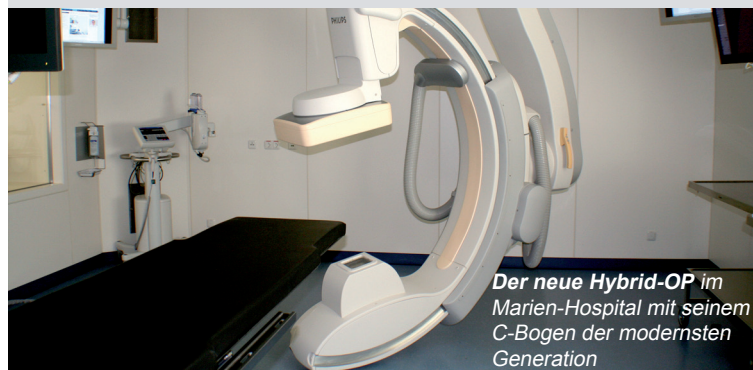
Der neue Hybrid-OP im Marien-Hospital mit seinem C-Bogen der modernsten Generation

Es gibt zwei Behandlungsmethoden: Den endovaskulären Stentgraft-Eingriff oder die konventionelle, also offene Operation. Beim endovaskulären Stentgraft wird über einen Schnitt in der Leiste ein Schlauch durch die Blutgefäße zur Aorta hin eingeführt. An Stelle des erkrankten Gefäßes wird dann eine Schlauchprothese platziert, die den Blutfluss wieder in normale Kanäle lenkt. Diese Methode des minimal-invasiven Eingriffes ist für den Patienten weniger belastend.